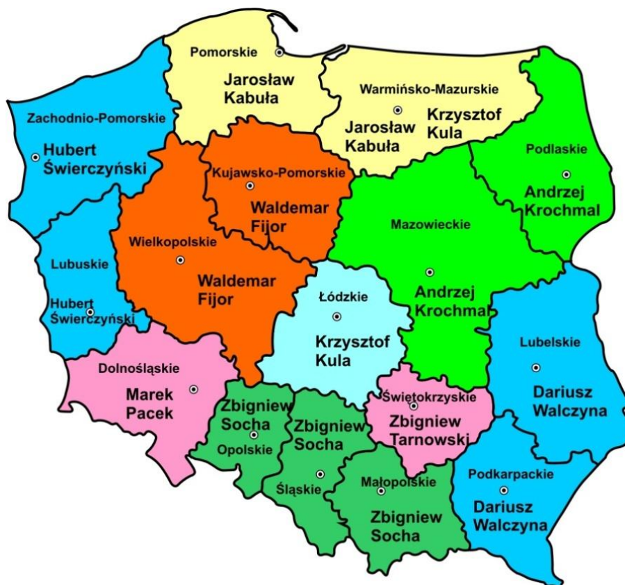
Rysunek 1. Mapa podziału województw na członków KInO (opr.: Dariusz Walczyzna)

Członkowie KInO współpracują z komisjami regionalnymi i podejmują działania aktywizujące poszczególne środowiska.