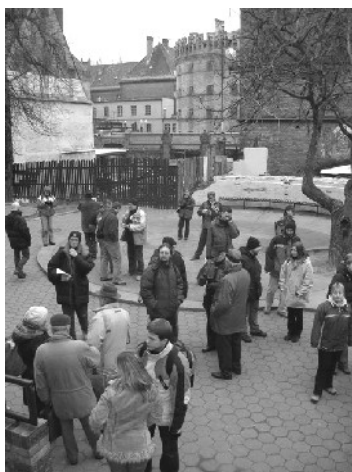
W oczekiwaniu na seans w planetarium

Na chętnych i wytrwałych, a było ich bardzo wielu, czekało jeszcze ognisko, kiełbaski, no i dalsze rozmowy już nie tylko o orientacji.