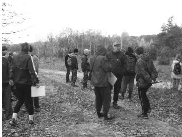
Jak zawsze interesujące rozmowy przed etapem.

szukać kolejnych jaskiń, gdzie punkty stały już tylko w wejściach. Drabina okazała się wąskim gardłem etapu, na szczęście ogromny tramwaj, który ją na pewien czas zakorkował, dotarł tam w momencie, gdy już wychodziliśmy na zewnątrz. Dalsza część trasy poszła w miarę gładko, na metę dotarliśmy nawet niezbyt spóźnieni, brakowało tylko dwóch punktów, których położenia nijak nie udało nam się ustalić.