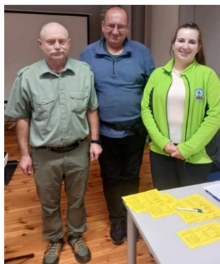
Fot. Nowi Przodownicy Imprez na Orientację

Pozostali uczestnicy egzaminu po spełnieniu brakujących im wymagań formalnych (stopień odznaki, staż w PTTK albo organizacja imprez i w tym przygotowanie map) z pewnością w niedługim czasie zasilą szeregi naszej kadry. Obiecujące zwłaszcza są nowe środowiska w Osiu (kujawsko-pomorskie) oraz w Iławie (warmińsko-mazurskie), gdzie będzie możliwość utworzenia nowych referatów weryfikacyjnych Odznaki InO.