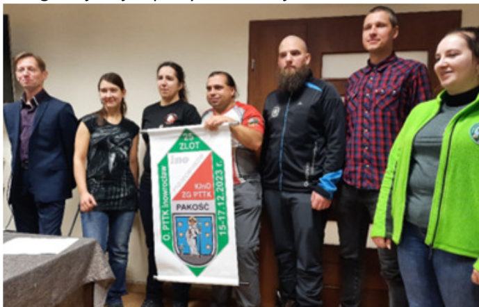
Fot. Nowa komisja

BnO Szczecin. W Komisji odpowiedzialny za tworzenie kalendarza imprez ogólnopolskich. W swoim szczecińskim środowisku wypromowałem markę Pucharu Starego Remola w MnO, kilka rund odbyło się w ramach Pucharu Polski oraz wieczorny cykl biegów na orientację „Szczecińska Dobranocka”- inauguracja tej imprezy miała miejsce w 2013 roku.